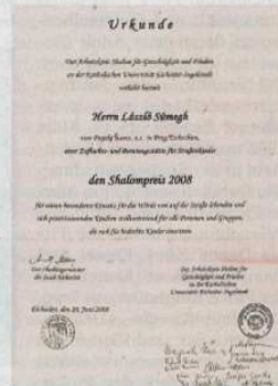
Eichstättler Shalom-Preis 2008.